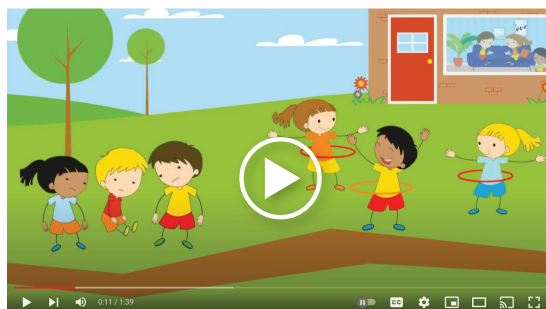
Voor een korte impressie van Het Bewegend Kind, klik op de afbeelding.

Meer informatie op www.hetbewegendkind.nl of mail naar info@hetbewegendkind.nl